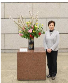
〈正風流一光会 桐生一光様〉