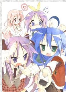
(C)美水かがみ／らっきー☆ばらだいす