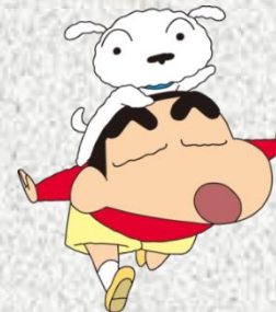
(C) 臼井義人/双葉社・シンエイ動画・テレビ朝日・ADK