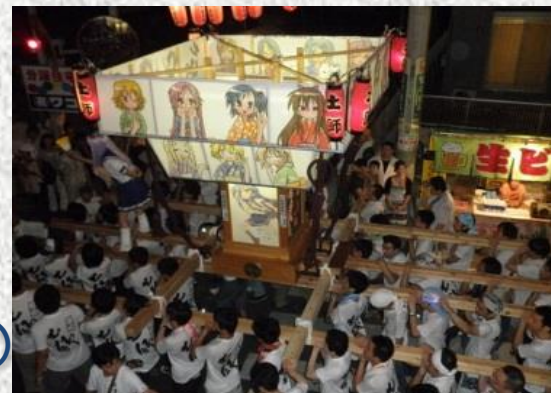
土師祭に登場した 「らき☆すた神輿」