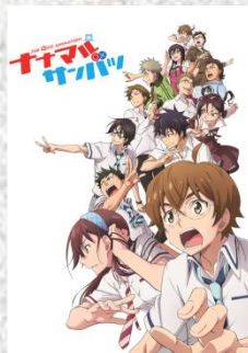
(C) 杉基イクラ/KADOKAWA (C) 703×クイズ研究会