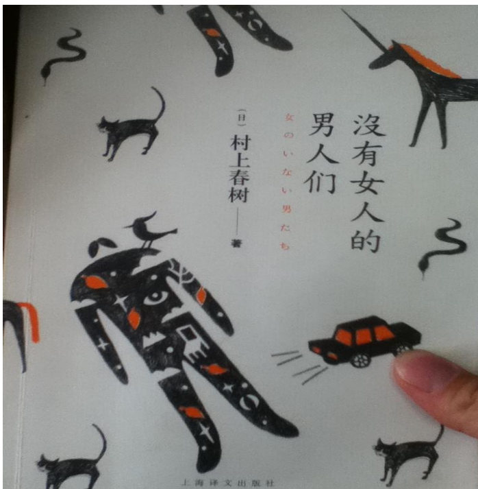
太原の本屋で村上春樹の本発掘。