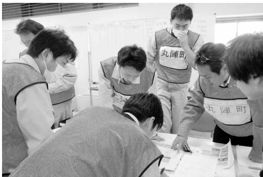
災害廃棄物処理図上訓練の様子