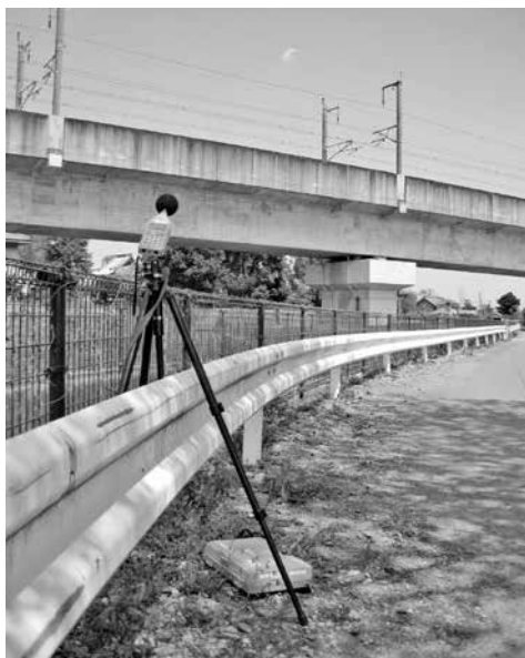
新幹線鉄道騒音測定