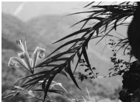
ミヤマスカシユリ