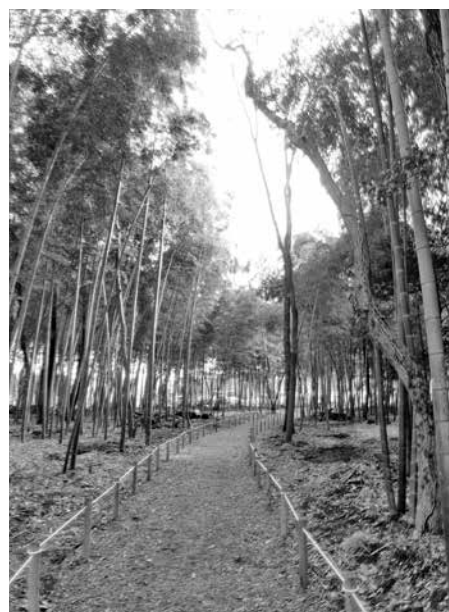
緑のトラスト保全第13号地 (無線山・KDDIの森(伊奈町))