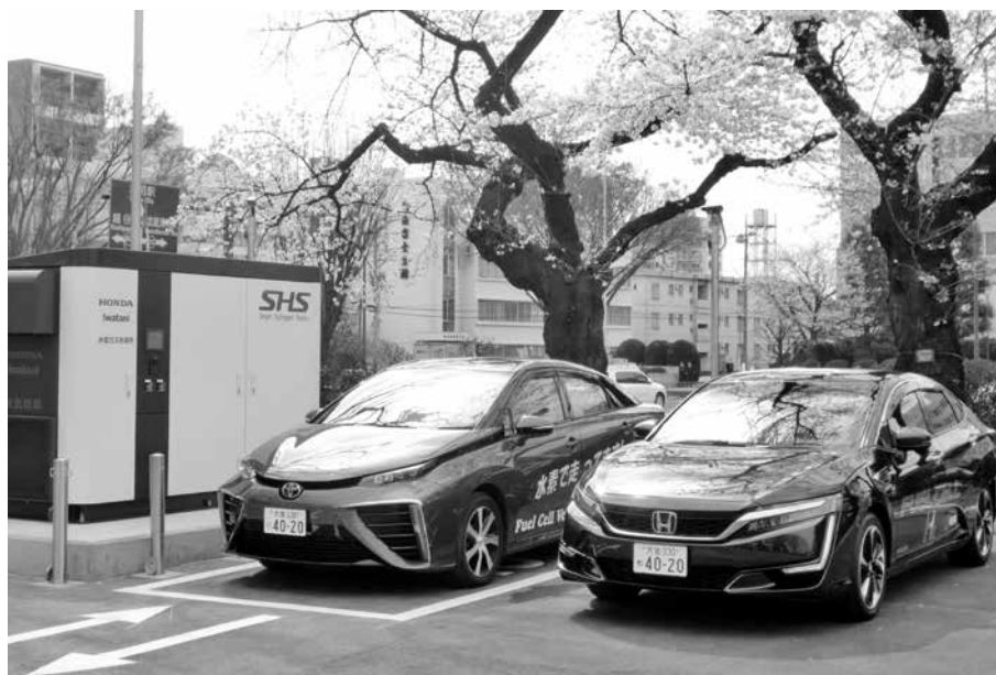
燃料電池自動車（FCV）と県庁スマート水素ステーション

ニュータウン開発ではなく、既存住宅のスマートハウス*化などによりエネルギーの地産地消*を図る「埼玉エコタウンプロジェクト」の検証等を行います。