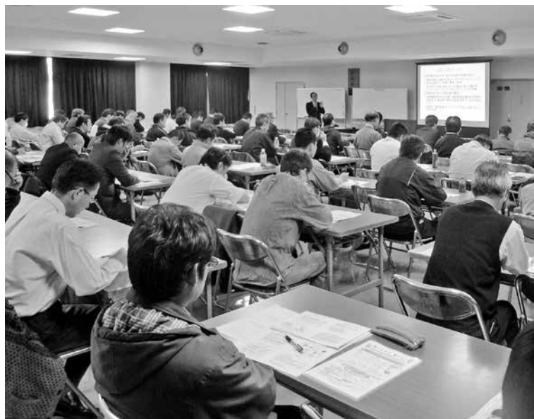
公害防止管理者・主任者向けフォローアップ研修