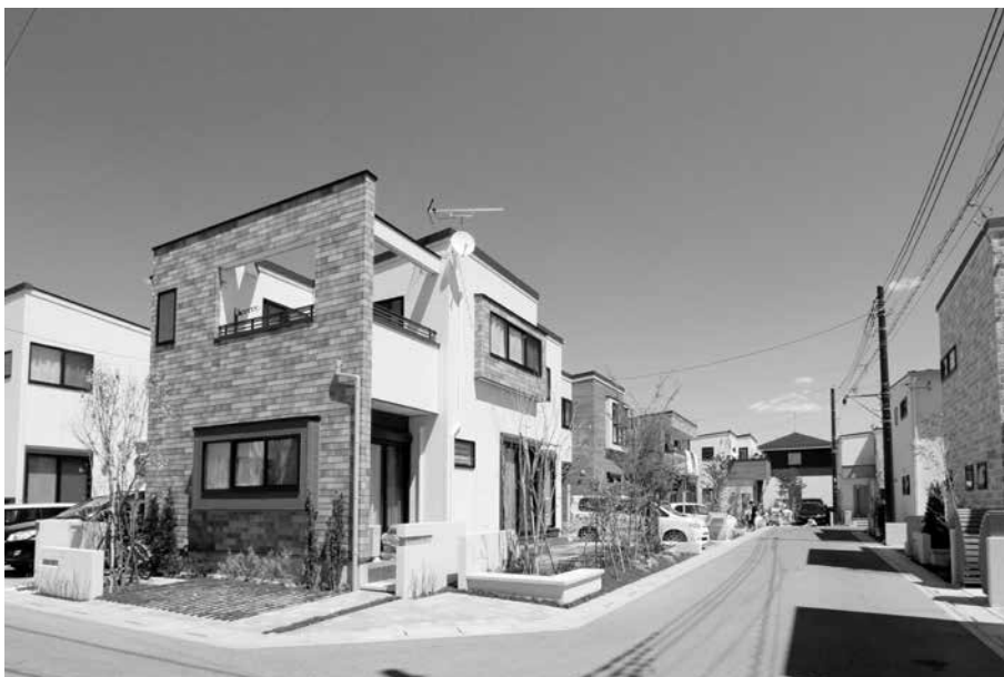
平成28年度に整備した先導的ヒートアイランド対策住宅街モデル(白岡市)