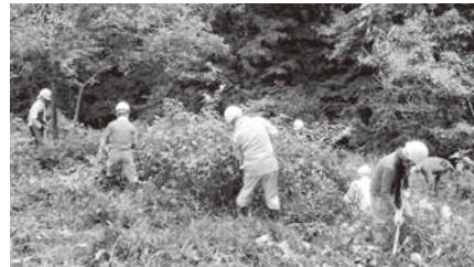
草刈り活動の様子

会員相互の交流や情報交換を通じて地域における活動の輪を広げ、県内各地の植樹活動などを促進していくため、緑化関係イベントなどの情報提供や植樹活動を行う団体・企業に対し、必要な苗木などの提供を行っています。