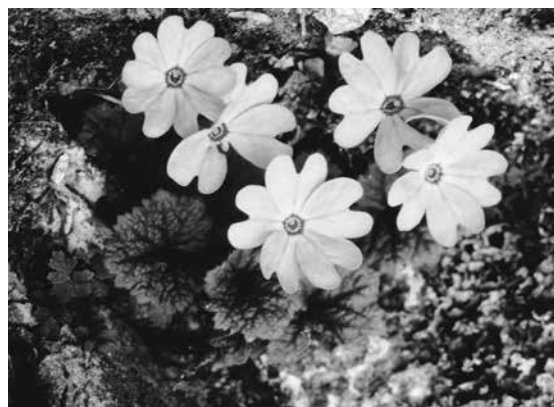
チチブイワザクラ