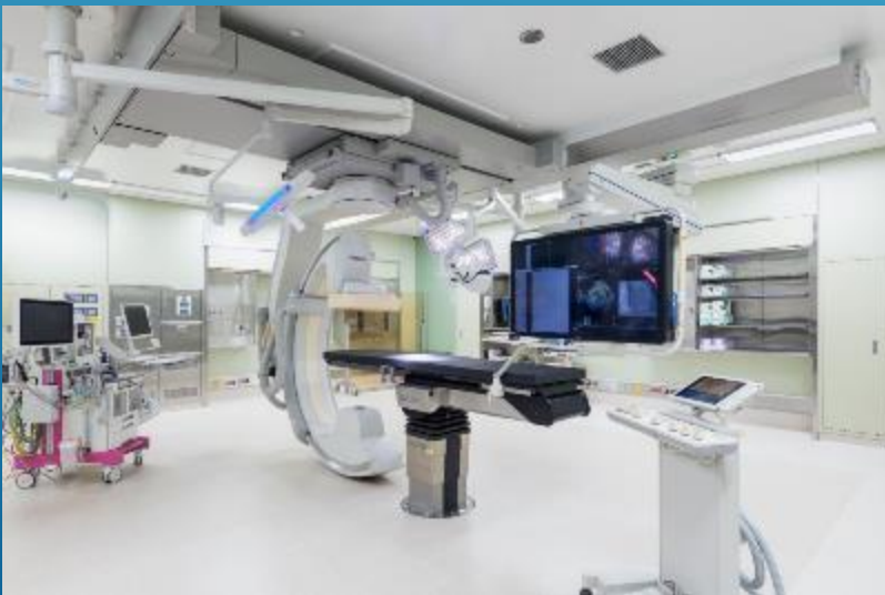
ハイブリット手術室