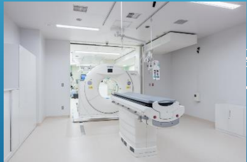
移動型CT隣接手術室