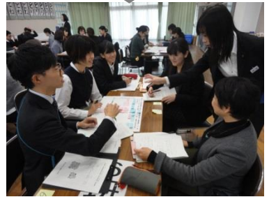
ワークショップ型研究協議 様々な見方や考え方の出し合い