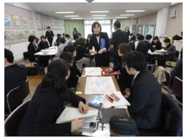
ワークショップ型研究協議 授業者との意見交換