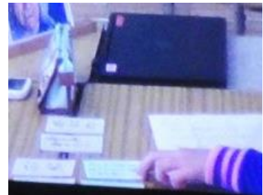
語句カードの工夫