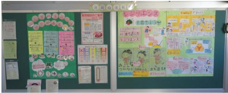
通級に対する理解を深めるための廊下の掲示物