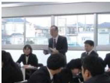
特別支援教育推進専門員 による実践的指導