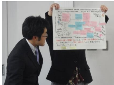
ワークショップ型研究協議 全体発表による意見交流