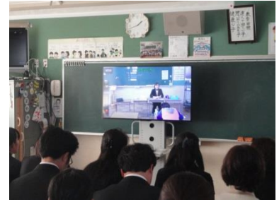
モニターを使った授業参観