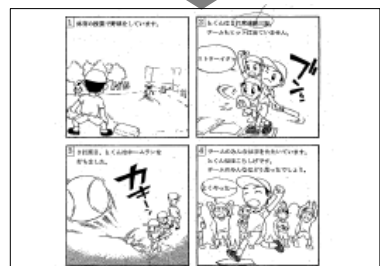
4コマ漫画を活用した 感情語表出訓練