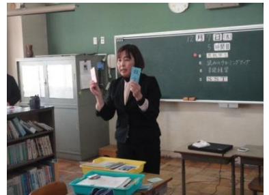
授業後の教室内見学 教材・教具の説明