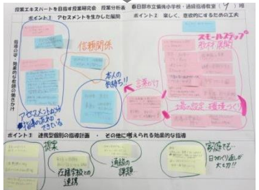
ワークショップ型研究協議 分析表による意見の構造化