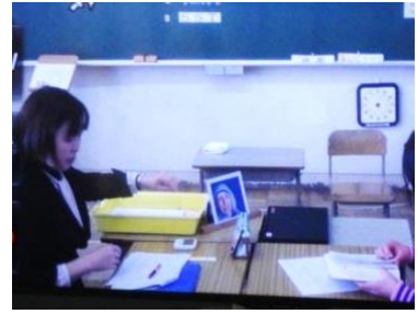
分からない語句の意味を 辞書で調べる