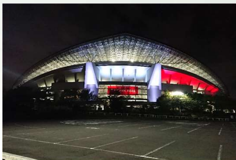
④改修後 多彩な演出が実施可能