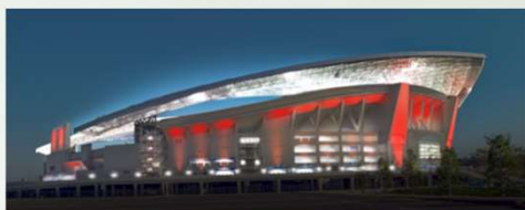
②シミュレーションによる検討