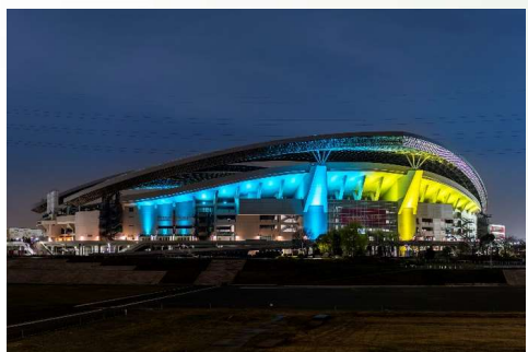
④改修後 多彩な演出が実施可能