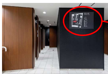
女性用トイレ 満空表示器で使用状況の見える化