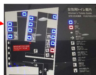
女性用トイレ 満空表示器