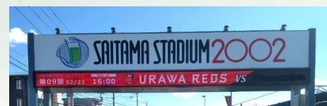
ウェルカムゲートの電光表示改修