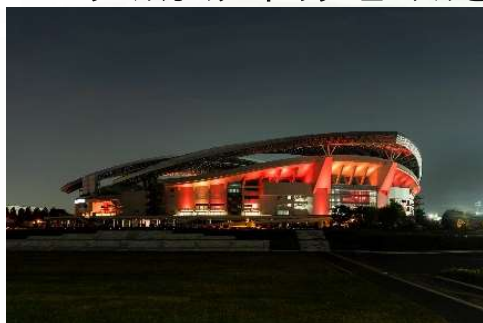
①ライトアップ設備改修前