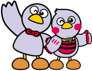
埼玉県マスコット「コバトン」「さいたまっち」

本事業は子どもエコクラブを対象とした事業です。助成金の申請に当たっては、 子どもエコクラブ全国事務局への登録が必要です。