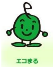
子どもエコクラブイメージキャラクター 「エコまる」

助成金の支給には様々な条件があります。 この募集要項のほか、 子どもエコクラブ活動支援事業助成金交付要綱を よく読んで上で申請してください。