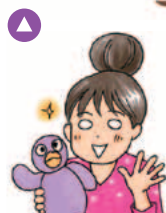
漫画家 二ノ宮 知子 さん