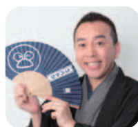
落語家 林家 たい平 さん