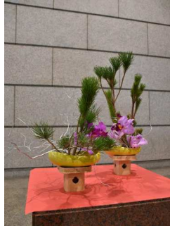
生け花を支え、上品さを高める三宝がポイント

A: まず、三宝はお供えなどに用いられるように、上品で尊い雰囲気を生み出します。また、銀色の柳は作品に奥行きと広がりを持たせるだけでなく高貴な印象を与えるのではないのでしょうか。三宝と銀色の柳の枝は他の花材を引き立て、作品のイメージを作り上げる存在です。