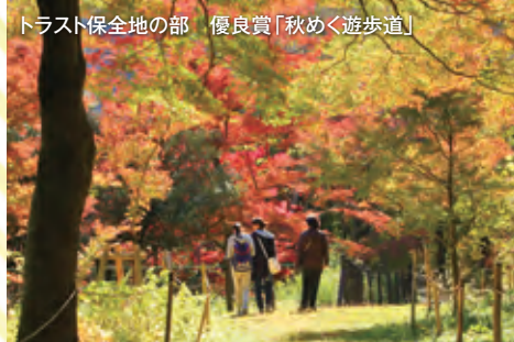
トラスト保全地の部 優良賞「秋めく遊歩道」