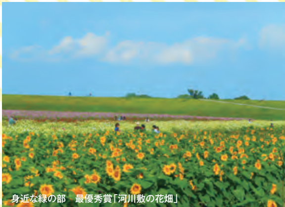
身近な緑の部 最優秀賞「河川敷の花畑」