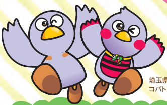
埼玉県マスコット コバトン&さいたまっち