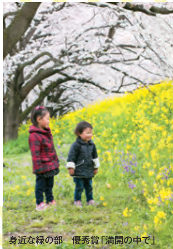
身近な緑の部 優秀賞「満開の中で」