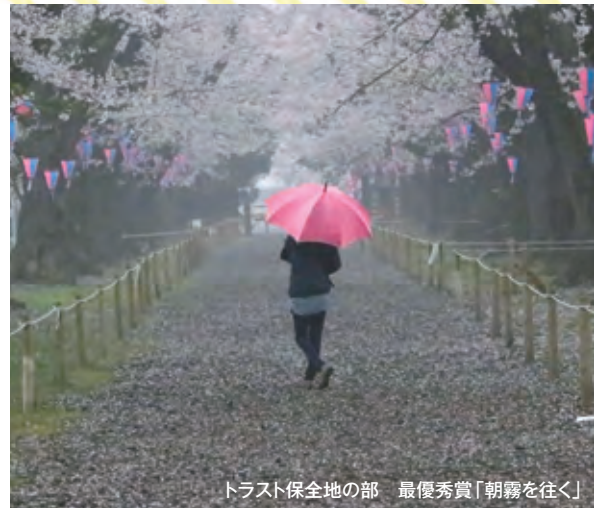
トラスト保全地の部 最優秀賞「朝霧を往く」