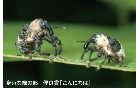
身近な緑の部 優良賞「こんにちは」