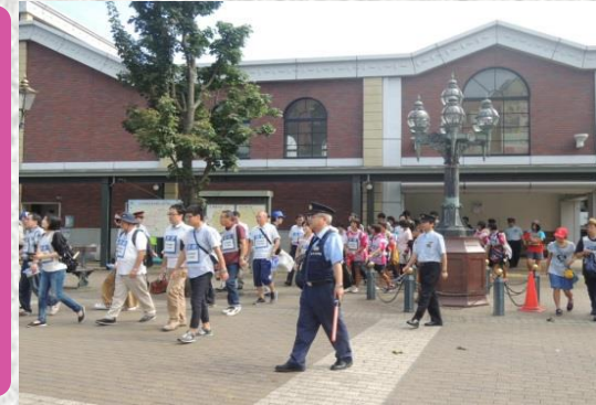
【帰宅困難者対応訓練】