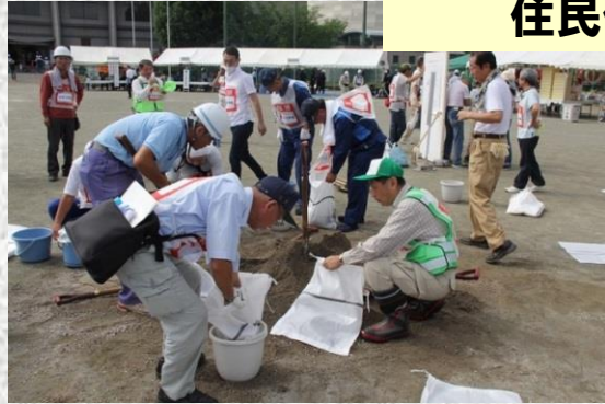
【積土のう工法の体験】