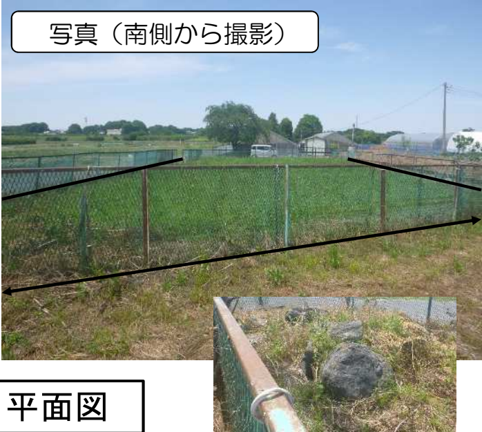
写真（南側から撮影）

【概要】 所在：さいたま市緑区新宿112 現況：畑 面積：475.84㎡ 接道：西側幅員4m程度（舗装） 南側幅員3m程度（未舗装） その他：見沼代用水土地改良区賦課金を負担していただきます。 （令和5年度：3.98円/㎡）