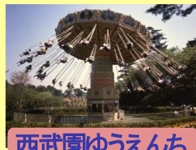
西武園ゆうえんち