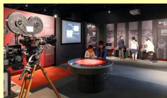
SKIPシティ映像ミュージアム