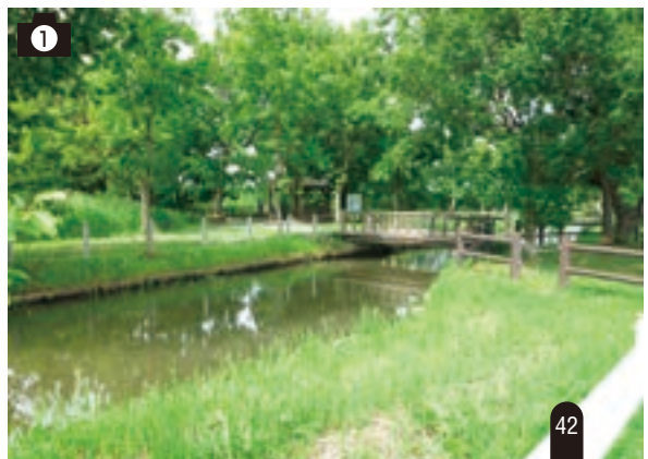
▶第20回「コンクール」 佳作「木々がくさへ道」

保全活動 毎月第1土曜日(8:30~10:00)及び 中下旬の土曜日または日曜日(その 都度決定) ▲第20回コンクール 佳作「ノウルシ咲く」