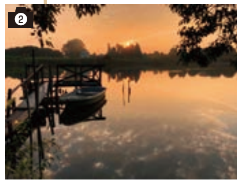
▲第21回コンクール 最優秀賞「早朝の黒浜沼」