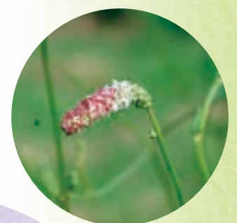
ナガボノワレモコウ

黒浜沼は谷地(低地に浅く水がたまり草が茂っている湿地)に元荒川の運んできた土砂が堆積してせき止められてできたものだよ。 水辺には、様々な水生植物群落が見られるから観察してみてね。 また、黒浜沼とその周辺に広がる田園風景は、蓮田市を代表する風景の一つだよ。