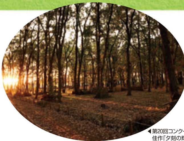
◀第20回コンクール 佳作「夕刻の輝き」