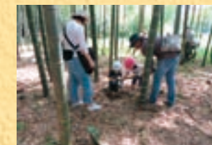
▲タケノコ掘り(1号地)