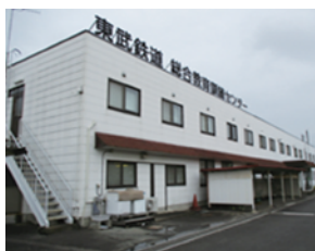
取材にお伺いした南栗橋事業所