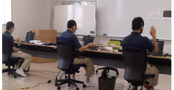
訓練中の様子 夢中になってパソコンに向かう受講生の皆さん。

タイピングの訓練がうまくできなくて、日誌に「悔しかった」と書いていた受講生もいたのですが、「悔しい」と思ってくれたのが、逆に嬉しかったですね。