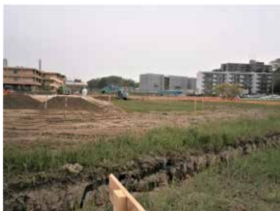
グランド盛土材として使用