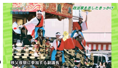
秩父夜祭に参加する副議長

副議長 そうですね。秩父人というだけでなく、埼玉県民として視野を広げますと、同じ県の中に秩父のような山や川など豊かな自然に囲まれた地域がある一方で、東京のような大都市もあります。いろいろな側面があって、非常に面白くて魅力のある県だなあ