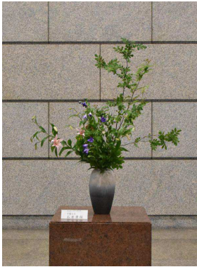
ウ、ユリ(スイートメモリーズ)