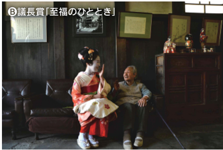
B 議長賞「至福のひととき」