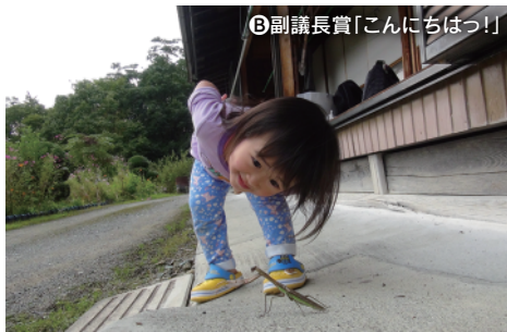
B 副議長賞「こんにちはっ!」