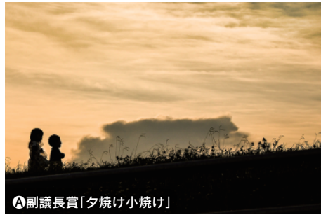
A 副議長賞「夕焼け小焼け」