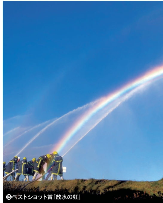
B ベストショット賞「放水の虹」