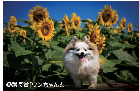
A 議長賞「ワンちゃんと」