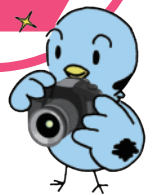
埼玉県議会マスコット「ポッポ」