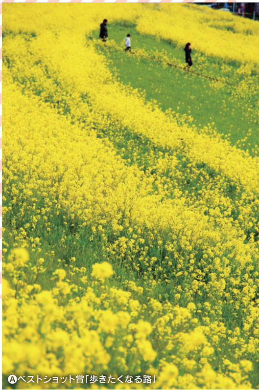
A ベストショット賞「歩きたくなる路」