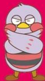
埼玉県のマスコット 「さいたまっち」