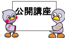
埼玉県マスコット 「さいたままっちゃん&コバトン」