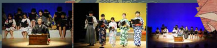
子ども劇団 記念公演 子どもたちによる群読劇「世のため後のため 埼玉保己一物語」