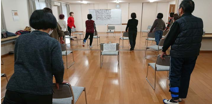
歌に合わせて体操