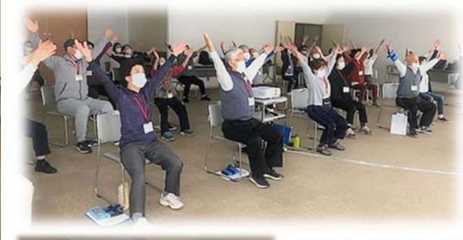
100歳体操以外に手芸やぬいぐるみ等もっており、素敵な作品が壁に貼られていました。全国各地のおもしろ民謡(踊り)なども行っているようです。