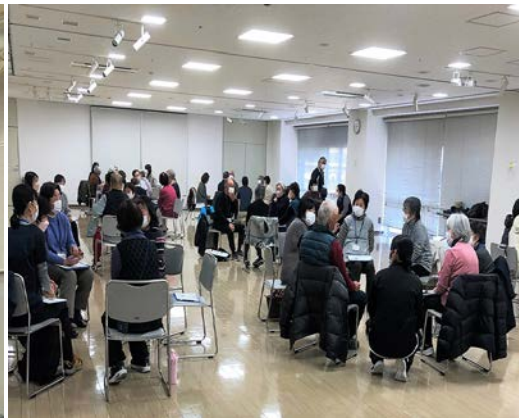
左上) 声出し解禁！ 右上) いきいきサポーター養成講座 下段) 自主グループ交流会