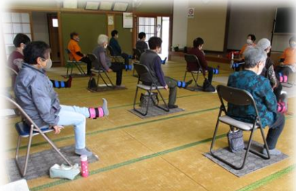
皆野町 自主グループ支援