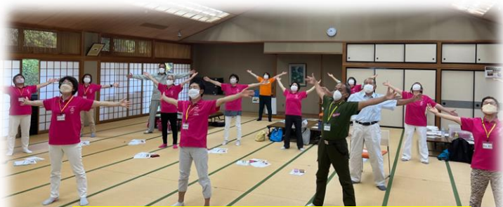
横瀬町 フォローアップ研修