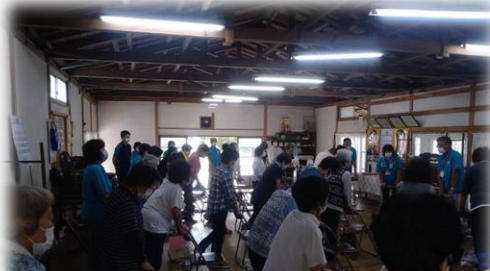
秩父市 自主グループ支援