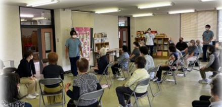
長瀬町 自主グループ支援

地域で活動している自主グループにリハビリ専門職がお伺いして、運動のアドバイスや活動継続の支援を行っています。