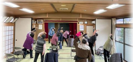
横瀬町 自主グループ支援