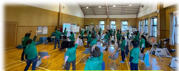
小鹿野町 フォローアップ研修