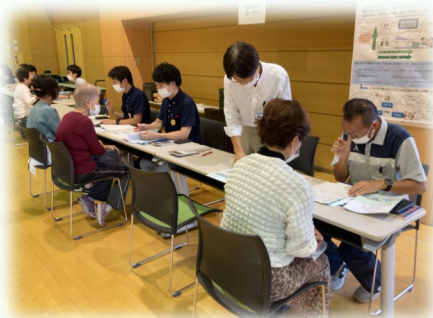
高齢者の保健事業と介護予防の 一体的実施(川越市)