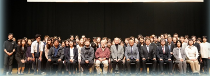
第13回 医療介護フォーラム

医療・介護の関係者が、市民も含め情報や、「価値の共有」を行い、学びや対話を通して、顔の見える関係づくり・連携・協働を進めています。