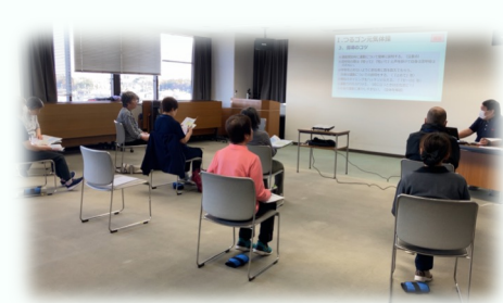
介護予防サポーター養成講座 (鶴ヶ島市)