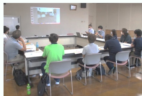
効果判定・課題抽出