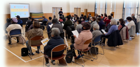
専門職による「きこえ」の講話 (吉見町)