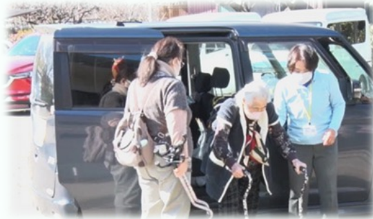
住民による助け合い活動 (移送・送迎支援) (川越市)