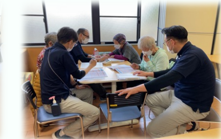
「対話」中心の専門職による かかわり (通所C) (川越市)