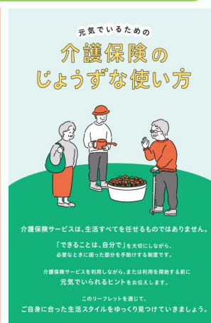
ガイドブック ・事例集