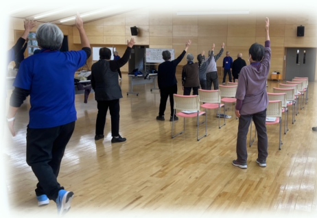
自主グループ活動を通じた 自助・互助の活動(鳩山町)