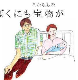
彩の国のどうとく「きょうもげんきに」より