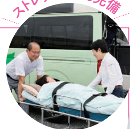
ストレッチャーも完備

起業/2012年 起業年齢/54歳 起業資金/約350万円 業務内容/介護タクシー業 所在地/秩父市 HP/http://abekea.versus.jp/