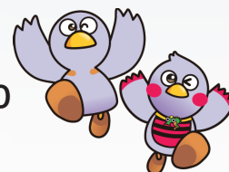
埼玉県マスコット 「コバトン」& 「さいたまっち」