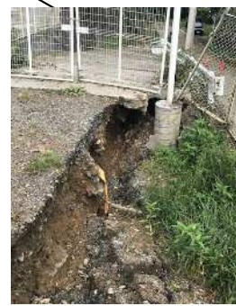
門扉、フェンスの損傷