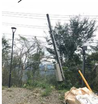
外灯、引込電柱の損傷