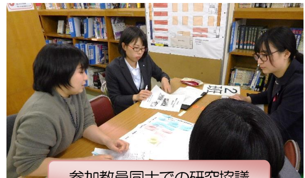
参加教員同士での研究協議