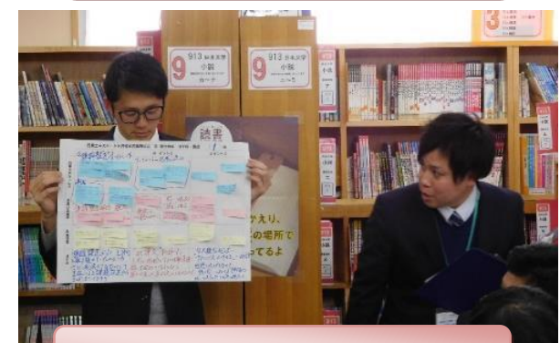
班ごとの協議内容を発表・共有