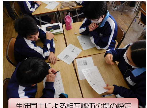
生徒同士による相互評価の場の設定