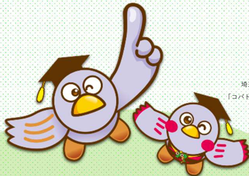
埼玉県のマスコット 「コバトン」「さいたまっち」