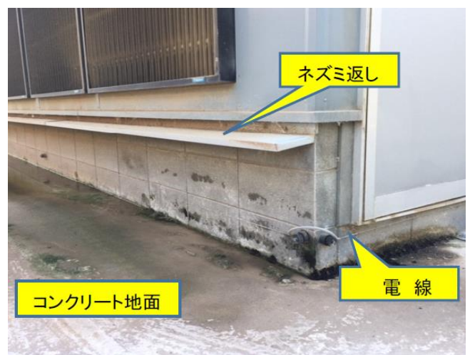
ねずみ及び害虫の駆除