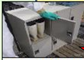
家きん舎専用の靴使用