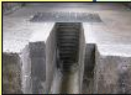
排水溝等からの侵入防止対策 (鉄格子の設置)