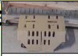
ねずみ対策 (トラップ設置)