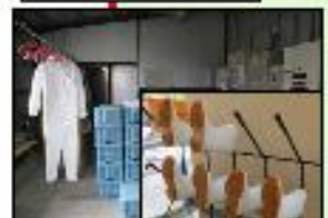
専用の服や靴の使用