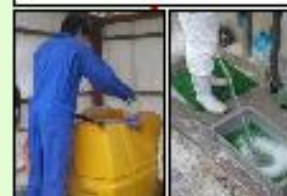
消毒液の定期的交換