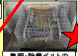
集卵・除糞ベルトの開口部の隙間対策