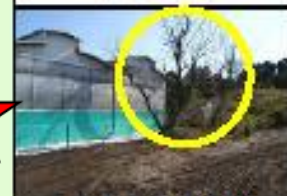
家きん舎周囲の樹木の剪定