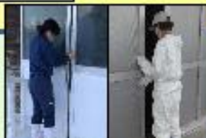
出入りの最小限化