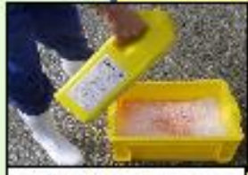
家きん舎毎の消毒