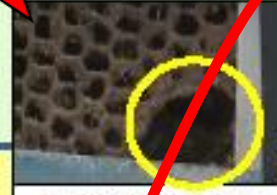
金網等の破損修繕