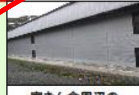
家きん舎周辺の整理・整頓