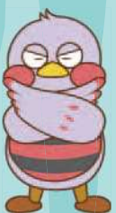
埼玉県マスコット「さいたまっち」