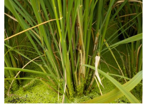
写真 紋枯病被害株