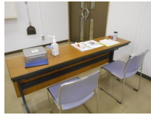
コロナ対応 検温・消毒・連絡先確認