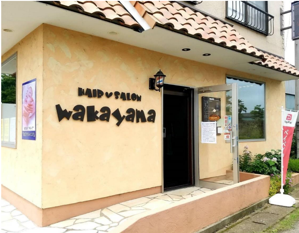
①店内のドア、窓を開け空気を循環