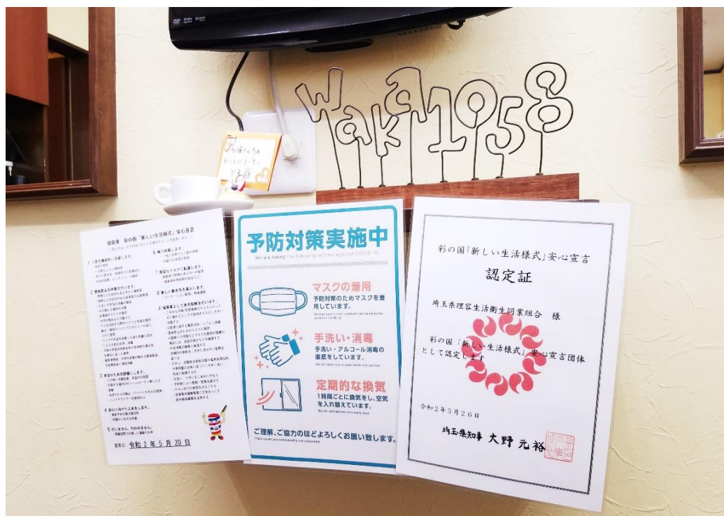
⑦埼玉県独自の認定証、安心宣言の掲示