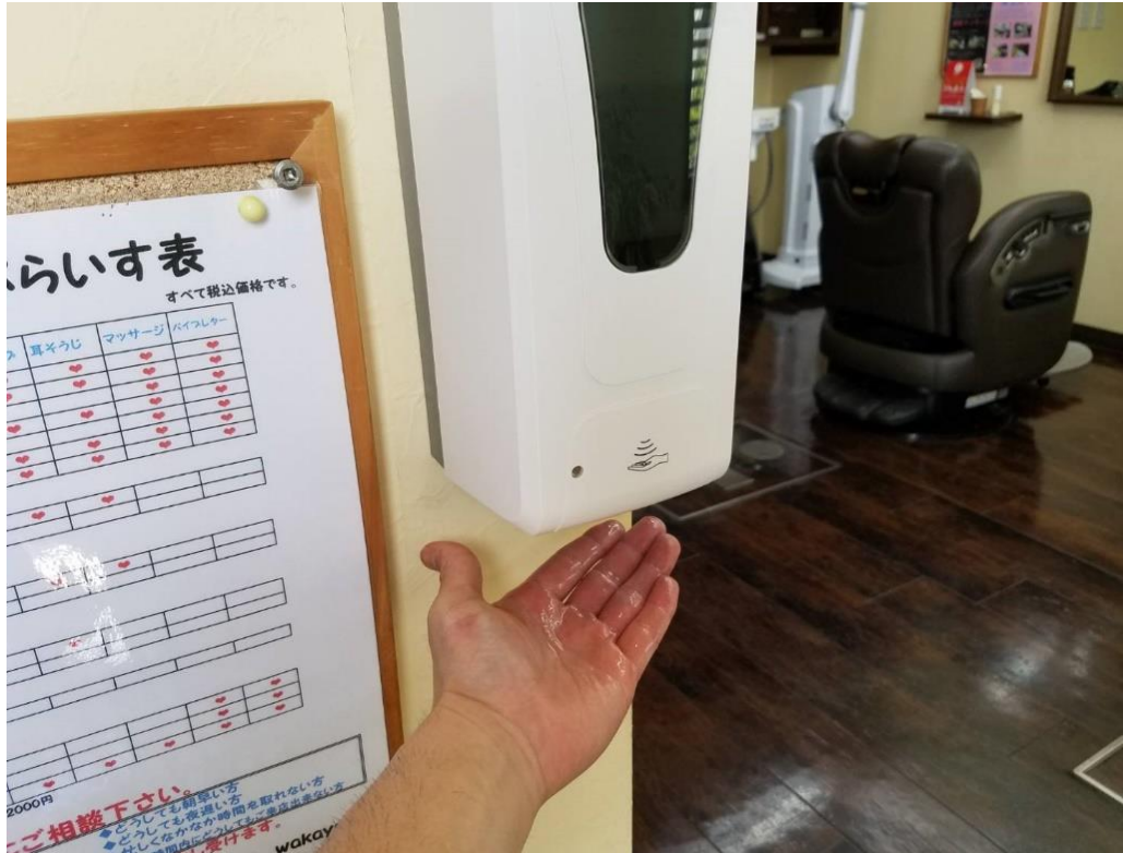
③ポンプを押さず、手に触れることなく 自動アルコール消毒機による手差消毒