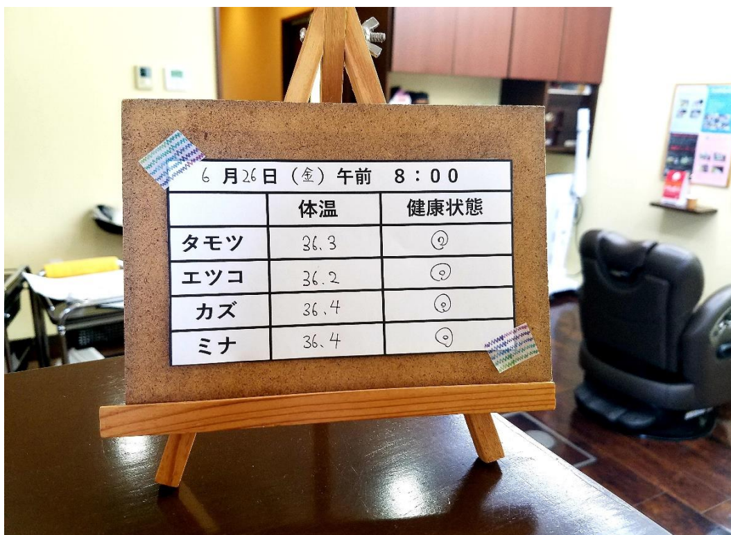
⑥毎日スタッフの健康状態を管理し、お客様に見える化