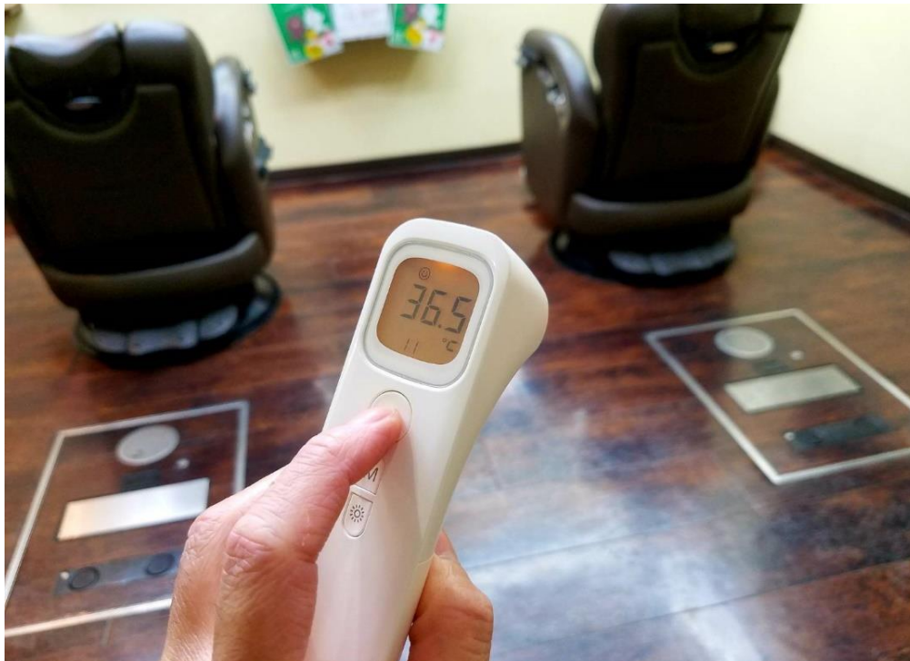
④非接触型体温計による入店時の検温