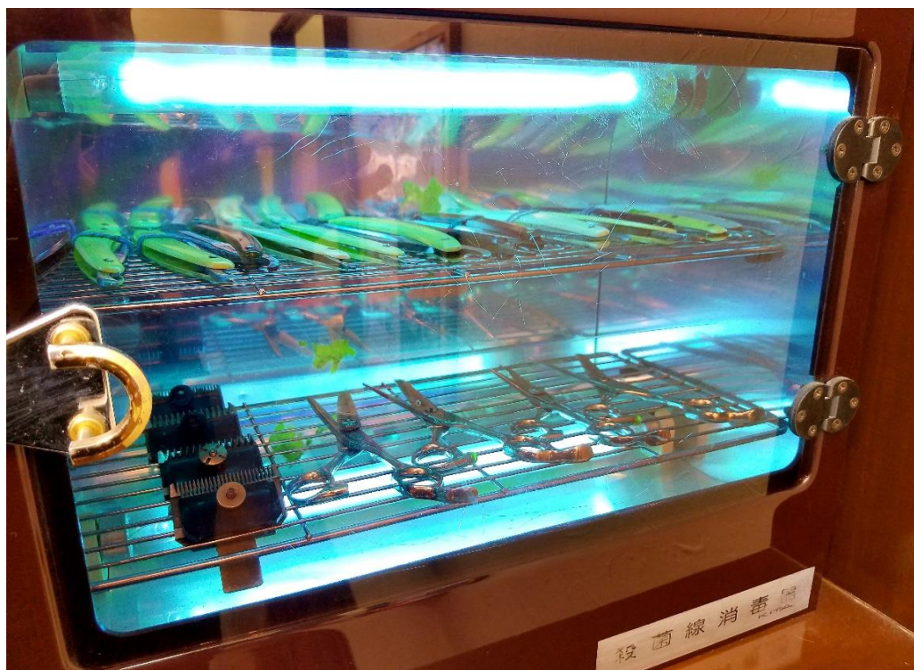
⑧紫外線消毒機による器具の消毒