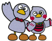
埼玉県マスコット 「コバトン」「さいたまっち」