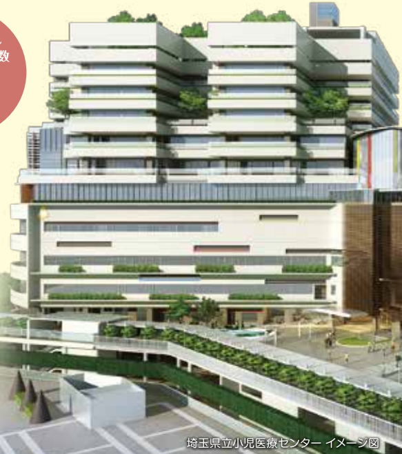
埼玉県立小児医療センター イメージ図