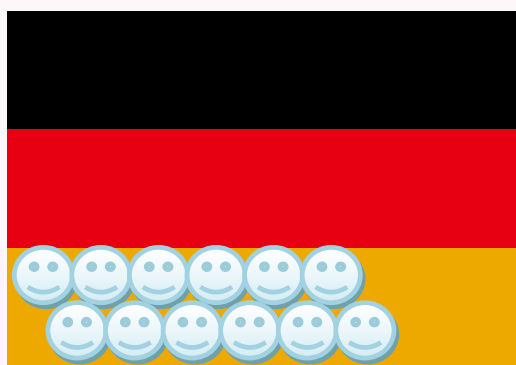
ドイツ 8.7人 / 100人