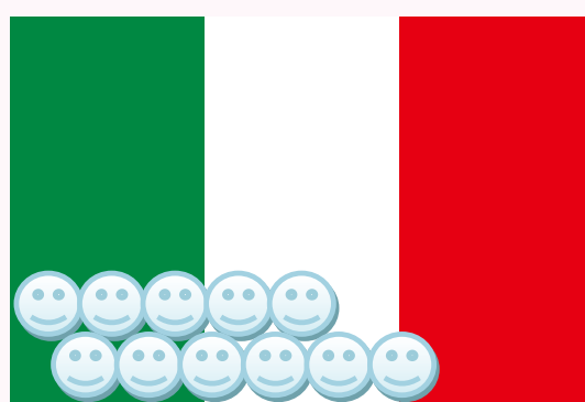
イタリア 10.1人 / 100人