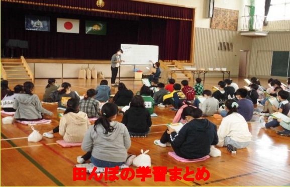
田んぼの学習まとめ