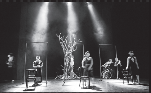
"血の婚礼" 2007 ©Kaneko Yoshiro