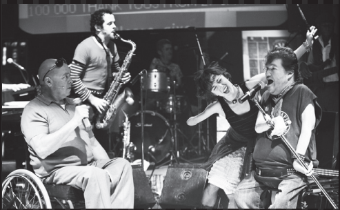
"Reasons to be Cheerful" 2010 ©Patrick Baldwin