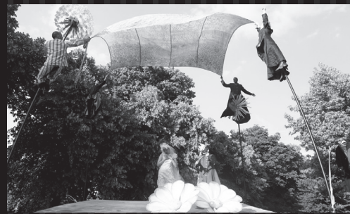
"The Garden" 2010 ©Alison Baskerville