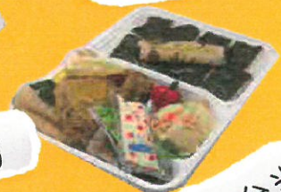
ミックスライ弁当

埼玉県東松山市松葉町2-17-43 TEL:0493-59-9997 FAX:0493-25-3110