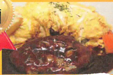
ハンバーグオムライス