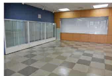
作品展示コーナー

新規利用には、団体登録や施設予約などの手続きが必要となる場合があります。 センターホームページ ( https://www.kouryu.net ) 又は総合受付 (TEL: 048-834-2222) で確認願います。 ※個人利用も可能 (障害のある方は無料) です。