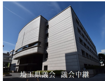
埼玉県議会 議会中継

「県議会 議会中継」では本会議などの様子を配信しています。B令和3年5月臨時会(5月31日)の様もご覧になれます。 また、テレビ番組「こんにちは県議会です」(テレビ埼玉)の映像も配信しています。 スマートフォンやタブレット端末でもご利用いただけますので、ぜひご覧ください。