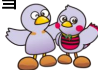
埼玉県マスコット