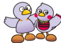
埼玉県マスコット 「コバトン」 & 「さいたまっち」